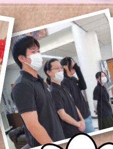
実技テスト前ドキドキ