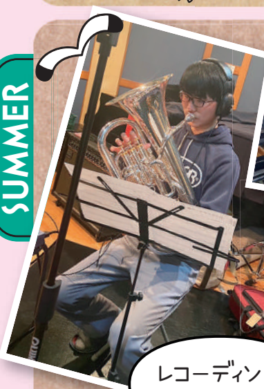
レコーディング実習